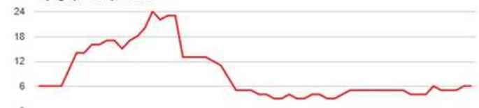
Topographie du parcours